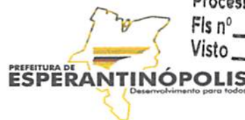
TABELA DE PREÇO

ESTADO DO MARANHÃO MUNICÍPIO DE ESPERANTINÓPOLIS DEPARTAMENTO DE COMPRAS CNPJ: 06.376.669/0001-69