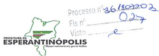
TABELA DE PREÇO

ESTADO DO MARANHÃO PREFEITURA MUNICIPAL DE ESPERANTINÓPOLIS DEPARTAMENTO DE COMPRAS CNPJ: 06.376.669/0001-69