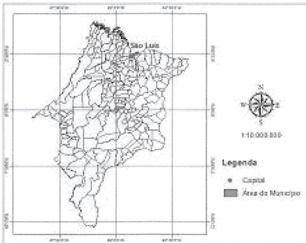
Figura 1 - Mapa de localização do município de Esperantinópolis-MA.

O acesso, todo pavimentado, a partir de São Luis, capital do estado, em um percurso total de 323 km, se faz da seguinte maneira: 209 km pela BR- 135 até o município de Alto Alegre do Maranhão, 114 Km pela BR-316 e pela rodovia estadual MA-247 até a cidade de Esperantinópolis.