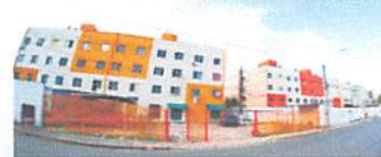
A REFORMA ESTÁ MONTANDO A PARCERIA DO BARRIO

As obras de revitalização do Conjunto Iperem Bequimão, em São Luís, entram na fase de finalização da reforma dos primeiros 24 blocos. As obras prosseguem com os 24 blocos restaurados. A ação é coordenada pelo Governo do Estado por meio da Secretaria das Cidades, e é desenvolvida em parceria com o Conselho Municipal de Desenvolvimento Urbano (Cmdu), as associações de moradores do residencial com intervenções nas áreas comuns internas e externas, pintura das fachadas, nos muros e ações de reparos na quadra poliesportiva e entorno. As obras visam garantir moradia digna e maior qualidade de vida para os moradores.