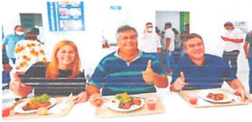
UNIDADE FOI INAUGURADA NA RUA 3, S/N, NA VILA OPERÁRIA, EM SÃO JOSÉ DE RIBAMAR

Nesta segunda-feira (21), dando continuidade às obras do governo do Maranhão que garantem a segurança alimentar das famílias maranhenses, o governador Flávio Dino inaugurou mais um Restaurante Popular em São José de Ribamar. A unidade, que foi inaugurada na Rua 3, s/n, na Vila Operária, é a 3ª do município e a 73ª do Maranhão.